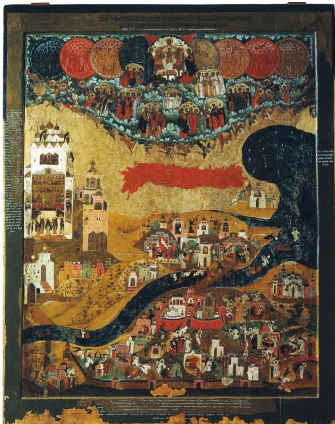
Ил. 3. Икона «Видение пономарю Тарасию». Новгород, XVII в.

Один из наиболее известных памятников моления святого за город, жители которого не исполняют волю Бога, – «Видение пономарю Тарасию» (ил. 3), вначале существовавший в виде отдельного сказания (и самостоятельного иконного образа) [Видение пономаря Тарасия 1984], а затем вошедший в Распространённую редакцию Жития Варлаама Хутынского.