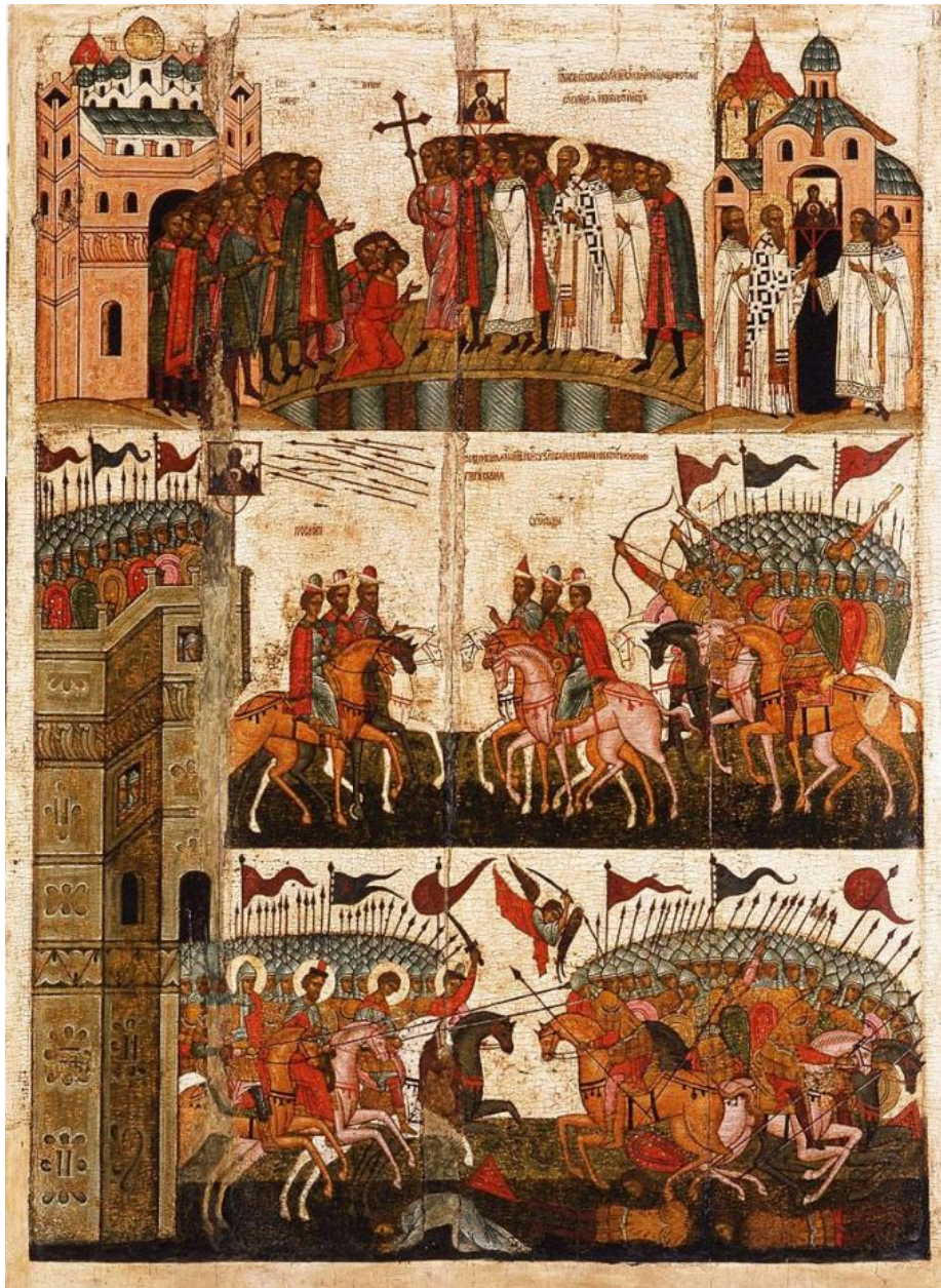
Ил. 1. Битва новгородцев с суздальцами. Новгородский государственный музей. XV в.

жет, ставший популярным иконографическим изображением, не только в новгородской традиции.